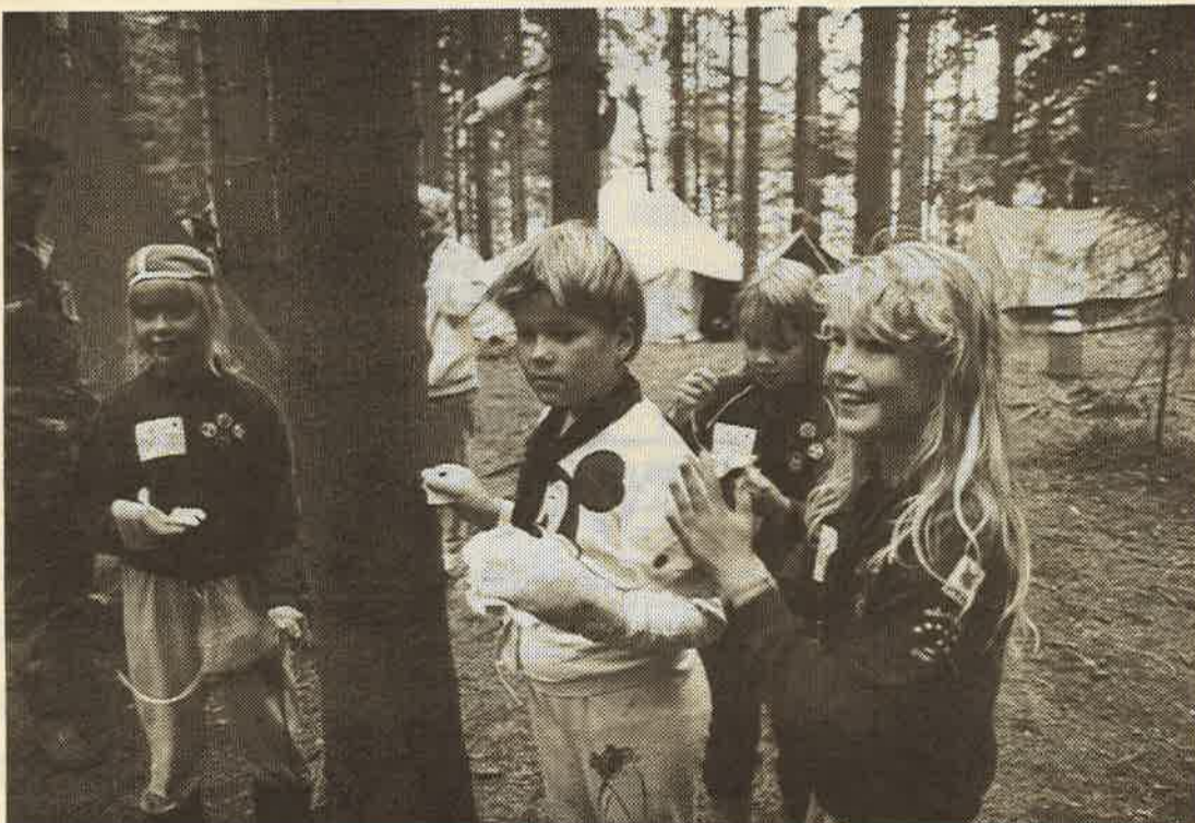
Sudenpentu-partiolaiset ovat 7—11 -vuotiaita. Vaakaniemessä heitä oli viime kesänä piirileirillä viitisensataa.

SOITA 3432 tai lähetä tilaus osoitteella: Kurun Sanomat PL 25 34300 KURU